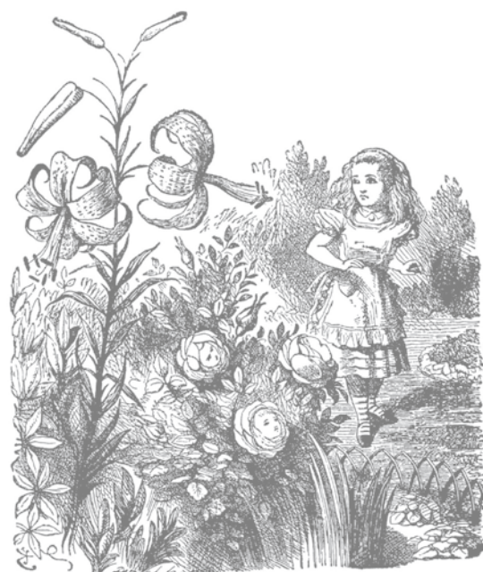
Illustration : Sir John Tenniel