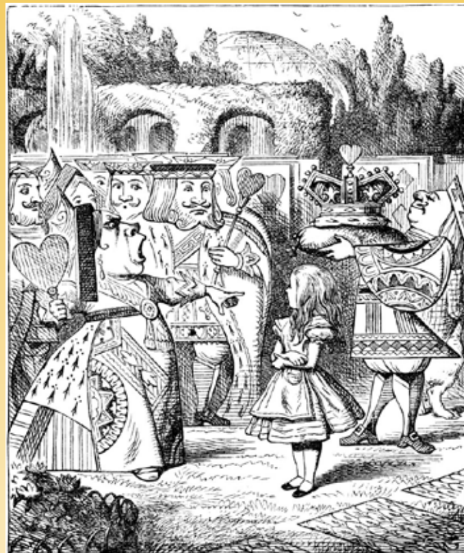
Illustration : Sir John Tenniel